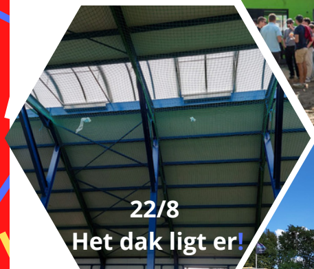
22/8 Het dak ligt er!