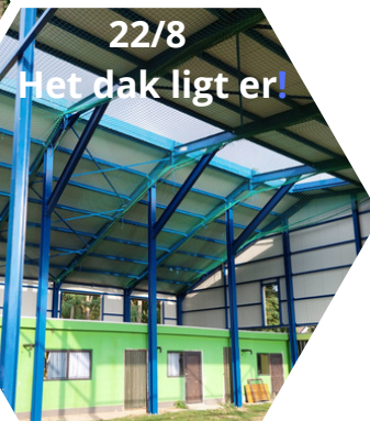
22/8 Het dak ligt er!