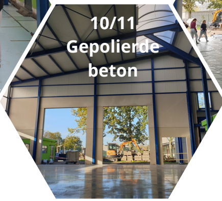
10/11 Gepolierde beton