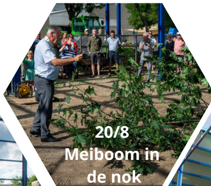
20/8 Meiboom in de nok