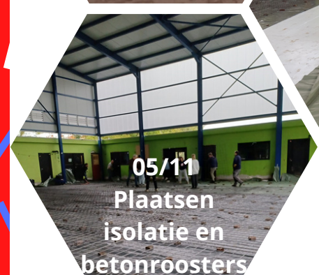
05/11 Plaatsen isolatie en betonroosters