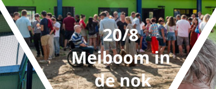
20/8 Meiboom in de nok