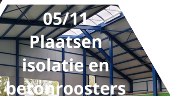
05/11 Plaatsen isolatie en betonroosters