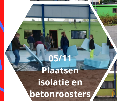
05/11 Plaatsen isolatie en betonroosters