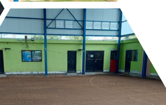
28/10 Terrein is klaar voor isolatie