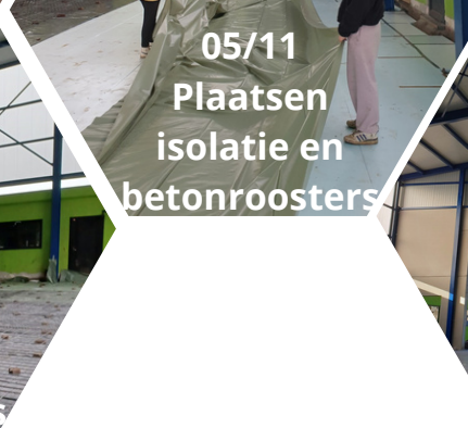
05/11 Plaatsen isolatie en betonroosters