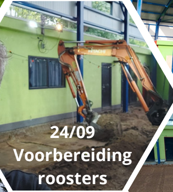
24/09 Voorbereiding roosters