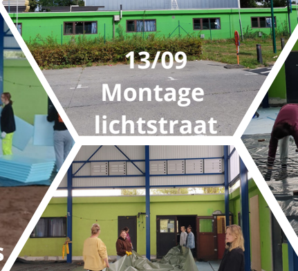
13/09 Montage lichtstraat