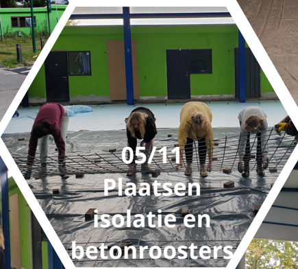
05/11 Plaatsen isolatie en betonroosters