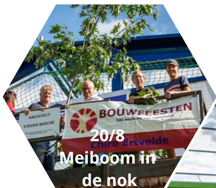
20/8 Meiboom in de nok